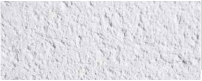
WEISS 2 mm (Standard)