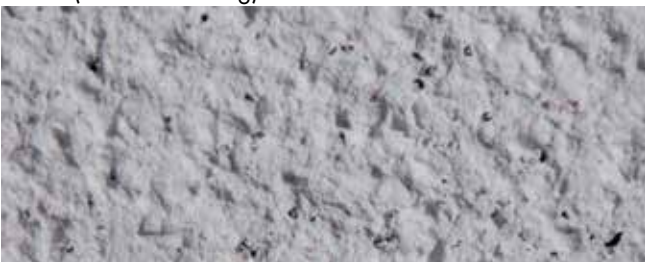
WHITE 4 mm + Colorsand (Sondermischung)